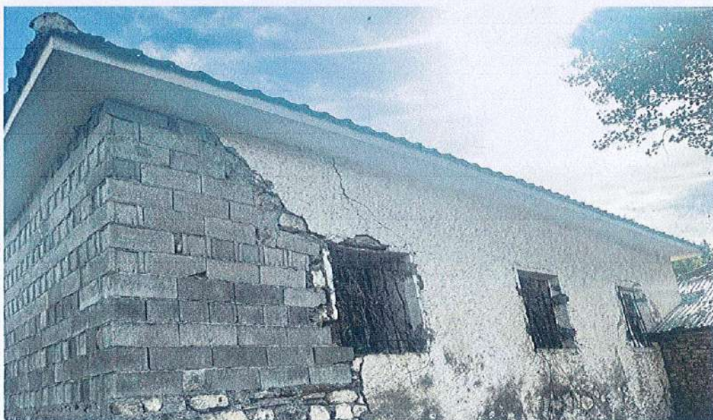
FRAGMENT NGA PJESA E PASME E OBJEKTIT