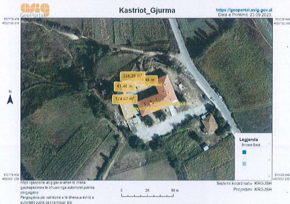
Figura 2. Pozicioni i objektit në hartë FOTOGRA METRI ASIG.