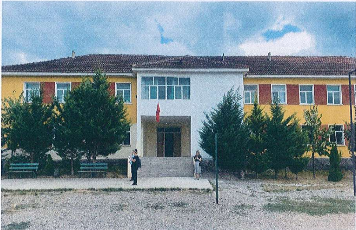
FRAGMENT NGA PAMJA BALLORE E OBJEKTIT