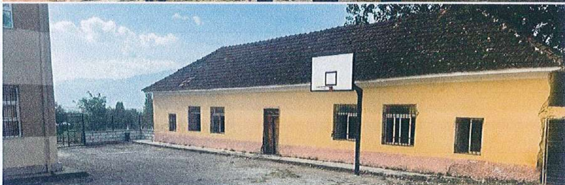
FRAGMENT NGA PAMJA BALLORE E OBJEKTIT