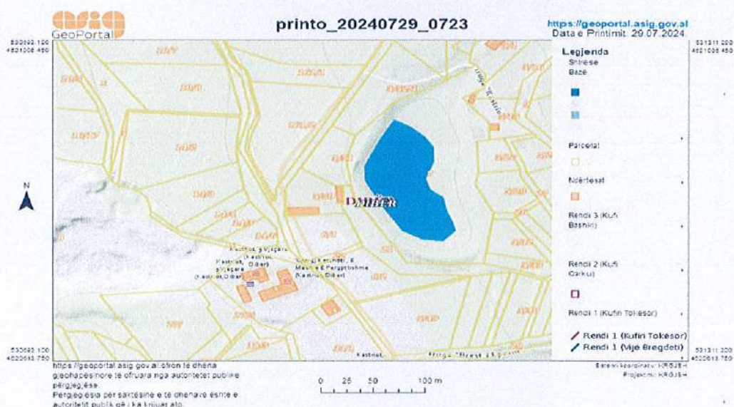
Figura 1. Pozicionimi i objektit lidhur me qendrën e fshatit Kastriot referuar Google Map

Shkolla 9-vjeçare "Kastriot" ndodhet në njësinë administrative Kastriot, në fshatin "Brest i Poshtëm" të bashkisë së Dibrës. Ndërtesa është një katëshe me lartësi rreth 6m, me ekspozim të ambientit të klasave në drejtimin veri dhe jug. Është një objekt i ndërtuar në vitin 1955, me mbulesë të pjerrët me çati me tjegulla qeramike.